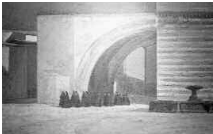
Basilica di S. Chiara

presso la tenuta di San Rossore, e ad Assisi si celebrò il matrimonio fra Giovanna di Savoia e Boris III di Bulgaria nel 1930.