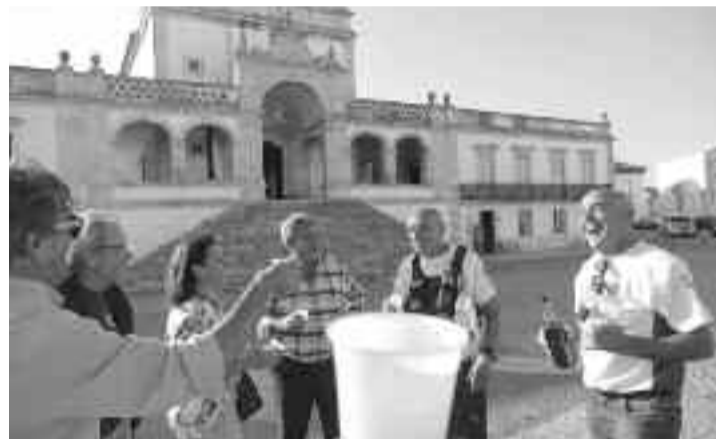
Brindisi con gli amici di Nazaré davanti alla Cattedrale di Citiu...