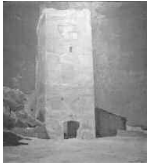
Porta di S. Giacomo

Rufino e frate Elia che sorregge un modello della basilica di San Francesco, ed altri frati, mentre alla destra ha posto tre clarisse e, scostata un poco, Santa Chiara, quel tanto da intravedere l'allora convento di San Damiano,