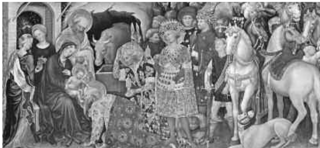
Gentile da Fabriano-presepe

prio tempo, le aspirazioni verso il Bene e la solidarietà tra gli uomini. In effetti davanti al Presepio noi usciamo da noi stessi, troviamo una dimensione di calma, di contemplazione della bellezza: la maternità, la famiglia, la giustizia... .."pace in terra agli uomini di buona volontà". Sono anche valori laici, a prescindere dal dono della fede. La natività unisce, ci fa capire la solidarietà...sotto la stella cometa, in una notte incantata con noi umili, con gli amici animali, ... contenti.