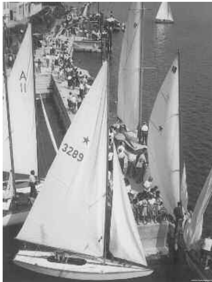
Le Star a Gargnano quando correvano la Centomiglia

la riva lombarda (Univela Campione, Canottieri Garda Salò, Cv Toscolano - Maderno) l'importante evento del circuito olimpico con il Campionato Italiano del Cico 2019, che diventerà Sognando Olympia sul Garda. Restano le altre iniziative del 2018, le nuove regate inchino di Gardone Riviera (in occasione della presentazione della Cento al Grand Hotel) e Gargnano. Potrebbe esserci un "inchino" anche alla città di Brescia (vedremo come!). Le collaborazioni in ambito sociale con Abe Brescia, Fondazione Terzo Pilastro, Itaca, Hyak Onlus, Fondazione Asm, Alpe del Garda e Ori Martin Brescia con gli eventi della Childrenwindcup e della Cento People. La nascita del circuito Garda Chal-