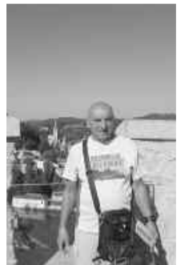
Visita al castello di Lourdes