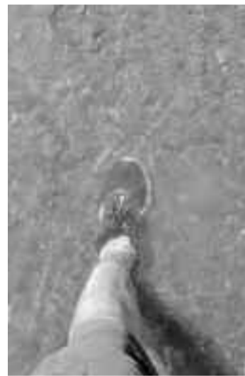
Tappa di Lourdes - Refrigerio dei piedi bollenti nel rigagnolo sognato

Che dire ancora. La vita è sogno. Forse. I confini, in questo caso, sono indecifrabili. Come il cammino, fatica e sogno. Un altro progetto? Mai smettere di sognare. Ci aiuta sulla strada della vita. Non è poco.