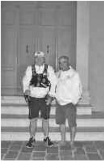
Partenza da Navazzo - Chiesa di Santa Maria Assunta