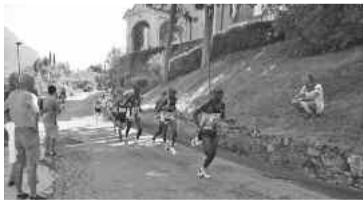
I runners africani in testa alla Diecimiglia 2018